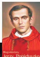
Relikwiarz Jerzy Popiełuszko