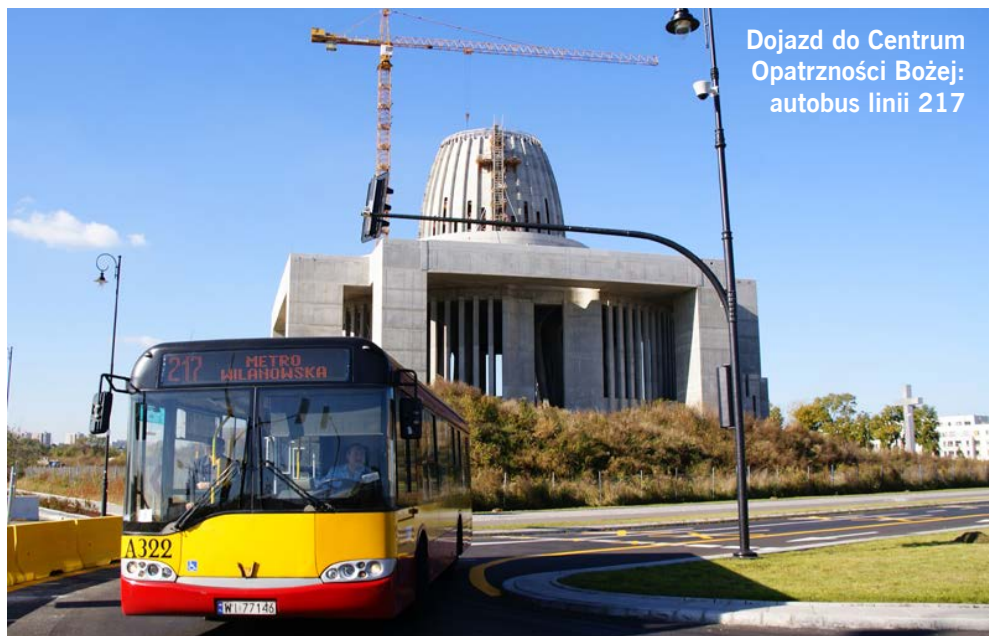
Dojazd do Centrum Opatrzności Bożej: autobus linii 217