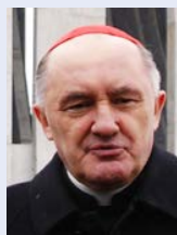
Kazimierz Kardynał Nycz Metropolita Warszawski

W 2012 roku przed Polakami stoi kolejny ważny etap. Największym wyzwaniem