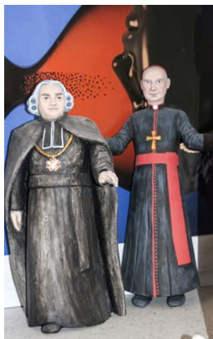
Król Stanisław August Poniatowski ze sceny uchwalenia Konstytucji 3 Maja oraz postać ks. Stefana Kardynała Wyszyńskiego ze sceny Millennium Chrztu Polski