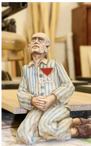
Ojciec Maksymilian Maria Kolbe ze sceny II wojny światowej