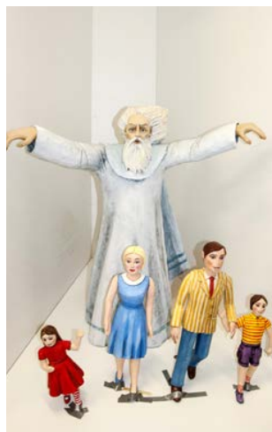
Fragment sceny stworzenia świata z figurami Boga Ojca oraz rodziną