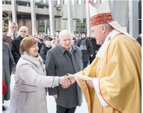
Ks. kard. Kazimierz Nycz przekazuje jubilatów pamiątkowe błogosławieństwo. Msza za rodziny, 30 grudnia 2016 r.

Po Eucharystii w Świątyni Opatrzności Bożej każde małżeństwo obchodzące jubileusz w 2017 r. otrzyma z rąk metropolity warszawskiego pamiątkowe błogosławieństwo. Zgłoszenia jubilatów przyjmujemy pod nr. tel. (22) 201 97 12 lub mailowo: dziekczynienie@centrumopatrznosci.pl