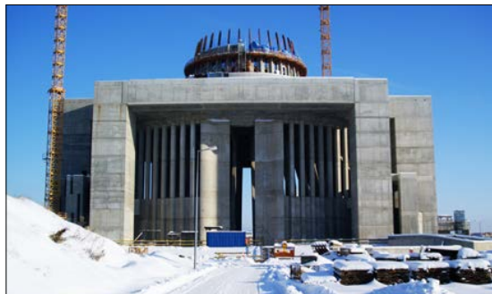
Budowę części kulturalno-muzealnej zrealizowano ze środków Ministerstwa Kultury i Dziedzictwa Narodowego.